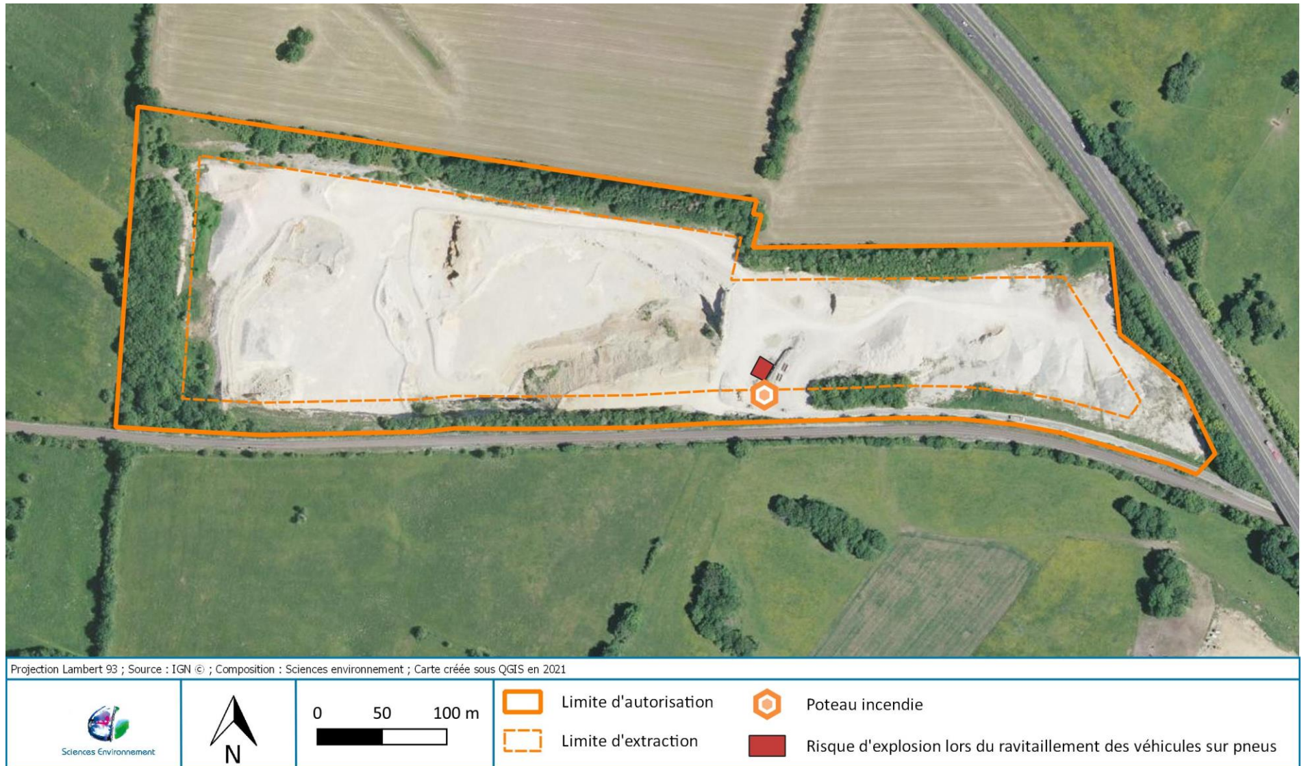
Figure 2 : Cartographie des risques au niveau du site d'Etalans

La carte présentée ci-après synthétise les zones jugées comme étant les plus « à risque » au sein de la carrière de d'Etalans.