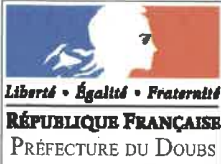
TABLEAU RÉCAPITULATIF DES CARACTÉRISTIQUES DU PROJET JOINT A L'AVIS DE LA CDAC du 28 octobre 2022 pour extension d'un ensemble commercial par extension d'un magasin Intersport sis 4 rue de l'Étang 25480 ÉCOLE-VALENTIN Pétitionnaire : SCI VALIMO 87 - (articles R. 752-16 / R. 752-38 et R. 752-44 du code du commerce)